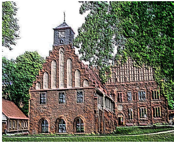
Abteigebäude des Klosters Zinna